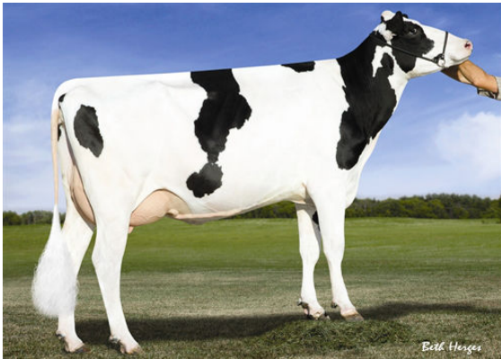
SANDY-VALLEY ROBUST RUBY FIFTH DAM